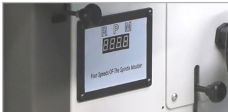
● Visor electrónico digital de velocidades.