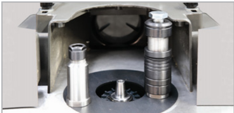
● Ejes intercambiables para fresas de eje 30mm. y fresas de mango. 2 pinzas de 8 y 12 mm.