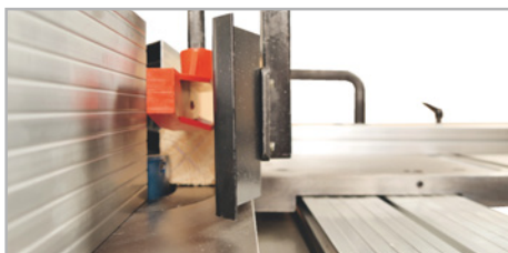
● Flejes prensores