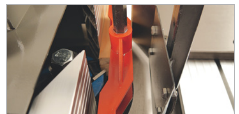
● Fleje guía madera