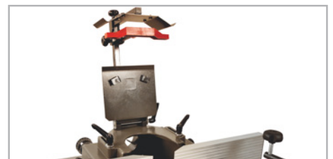
● Protecciones abatibles