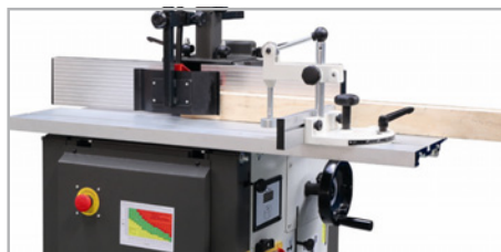
● Carro espigar de aluminio.